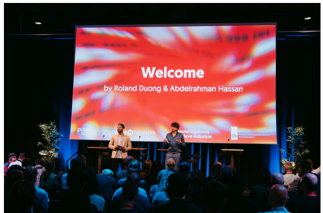
PublicSpaces Conferentie 2024

Waar de conferentie in de eerste jaren in het teken stond van bewustwording, het zoeken naar oplossingsrichtingen en het bouwen van een nationaal en internationaal netwerk zagen we in 2024 dat veel bouwstenen inmiddels zijn gelegd: er is een stevig netwerk gebouwd; digitalisering op basis van publieke waarden staat op vele agenda's - van publieke organisaties tot en met de politiek - en er zijn steeds meer tools en platforms die bijdragen aan het publieke belang. Het is nu tijd om de stippen met elkaar te verbinden en samen onze digitale toekomst vorm te geven.