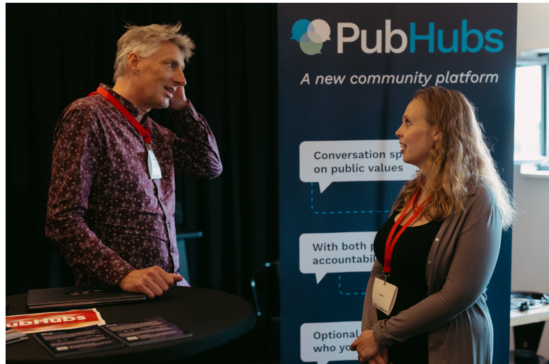
PubHubs stand tijdens de Conferentie 2024